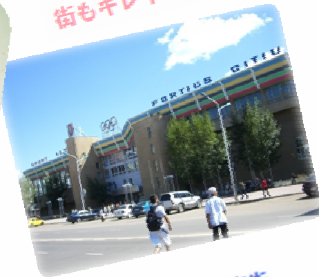
エルデネトの商店街