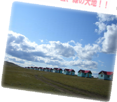
青い空、白い雲、緑の大地！！